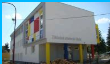
(MŠ a ZUŠ)